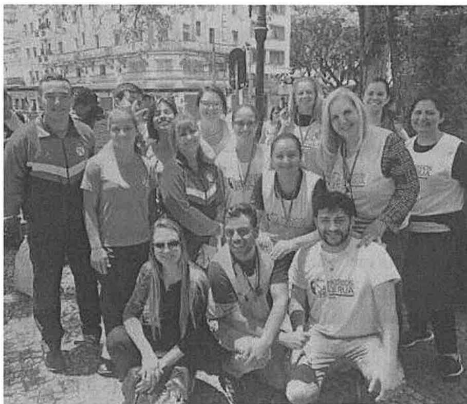
(Flagrante da ação social na Praça Tiradentes)

Com base nesses textos motivadores, você deverá produzir um texto de opinião argumentando sobre valores importantes no mundo atual, mas que estejam em falta, isto é, que precisem ser cultivados mais entre as pessoas, segundo a sua opinião.